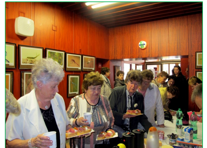
Blick in der Pause

Ein schöner Nachmittag, der allen in guter Erinnerung bleiben wird! Hoffentlich gibt es das bald wieder!