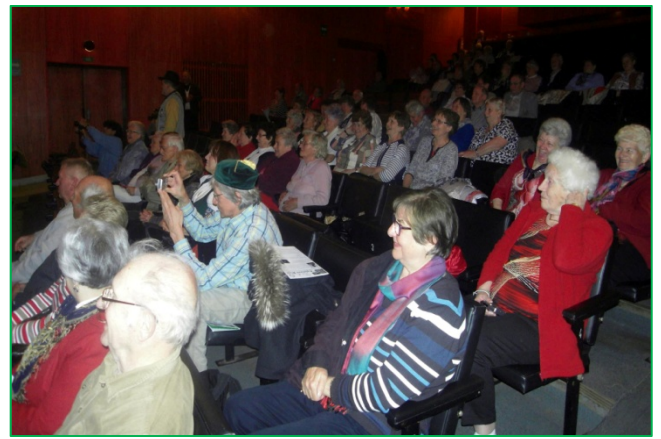
Ein Blick ins Publikum