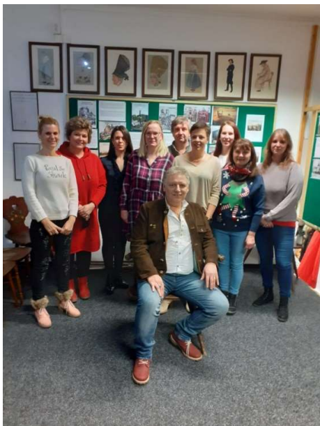
Die Gruppe aus Franzensbad